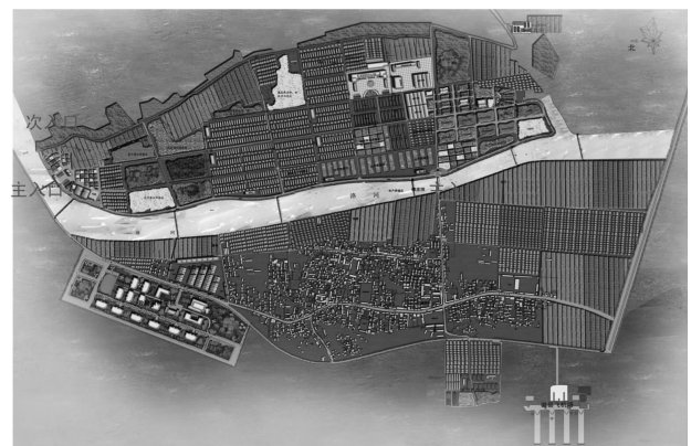
图1 泥阳现代农业示范区总平面示意

3.2.1 设施蔬菜园 位于示范区中部,规划面积为56.67 hm 2 。通过引进优质蔬菜新品种,采取“大棚+小拱棚+营养钵”和“温室+地膜+营养钵”等模