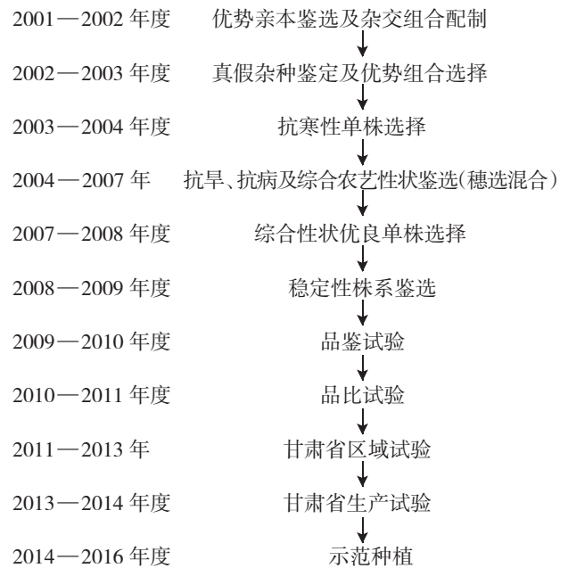
图 2 陇鉴 108 选育过程

2009—2010 年度在甘肃省农业科学院镇原上肖试验站进行的冬小麦品鉴试验中, 陇鉴 108 生育期内表现抗寒性 1 级, 抗旱性 1 级, 高抗条锈病, 丰产潜力大, 后期落黄好, 穗层整齐, 株高适中, 籽粒饱满。平均折合产量为 4 802.4 kg/hm 2 , 较对照品种陇鉴 196 增产 6.37%, 居 49 份参试材料的第 5 位。