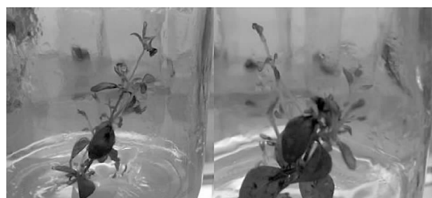
图 1 百里香初代培养最佳效果