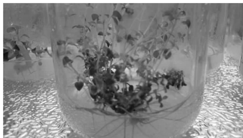
图3 百里香生根培养最佳效果