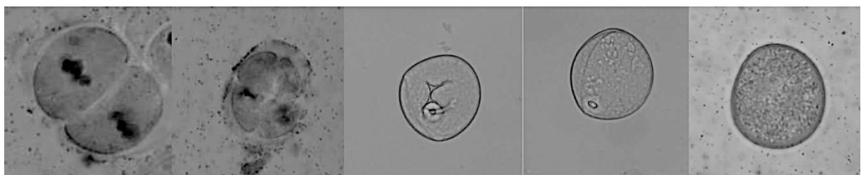
(a)二分体时期 (b)四分体时期 (c)单核居中期 (d)单核靠边期 (e)成熟期

在光学显微镜下对青稞品系 0841-6 不同时期小孢子进行观察的结果(表 1)可以看出,当旗叶距在 3~8 cm 时,主要以小孢子四分体时期为主,也有少量散落分布的二分体和单核早中期的小孢子,此时细胞质颜色浅,细胞核易见。旗叶距增加到 8~13 cm 时,四分体小孢子逐渐减少,单核早中期小孢子数量居多,同时可观察到单核靠边期和成熟期小孢子。当旗叶距在 13~18 cm 时,单核靠边期小孢子数量急剧增加达到峰值,四分体小孢子几乎消失,单核早中期小孢子数量减少,同时出现成熟期小孢子。旗叶距 >18 cm 时,单核早中期和靠边期的小孢子减少甚至消失,视野内以成熟期小孢子为主。