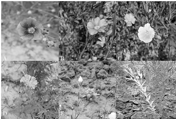
A 为花瓣颜色深; B 为正常花; C 为花瓣颜色浅; D 为畸形花; E 为花瓣不展开; F 为黄化苗

田间观察胡麻表型变异可知, 褐色籽粒品种轮选 3 号、CDC SoRel 和 C9625 均出现了黄化苗、畸形花、花瓣不展开、花瓣颜色变异株、分茎和分枝多, 茎扁平、簇头、早熟、不育等变异类型(图 1、图 2)。统计了黄化苗、畸形株、畸形花、花瓣色变深、花瓣色变浅等变异类型株数(表 3)。浅黄色籽粒品种张亚 2 号和内亚 6 号未发现上述表型变异株。这些不同的变异类型, 为胡麻进一步的遗传改良提供了丰富的种质资源。